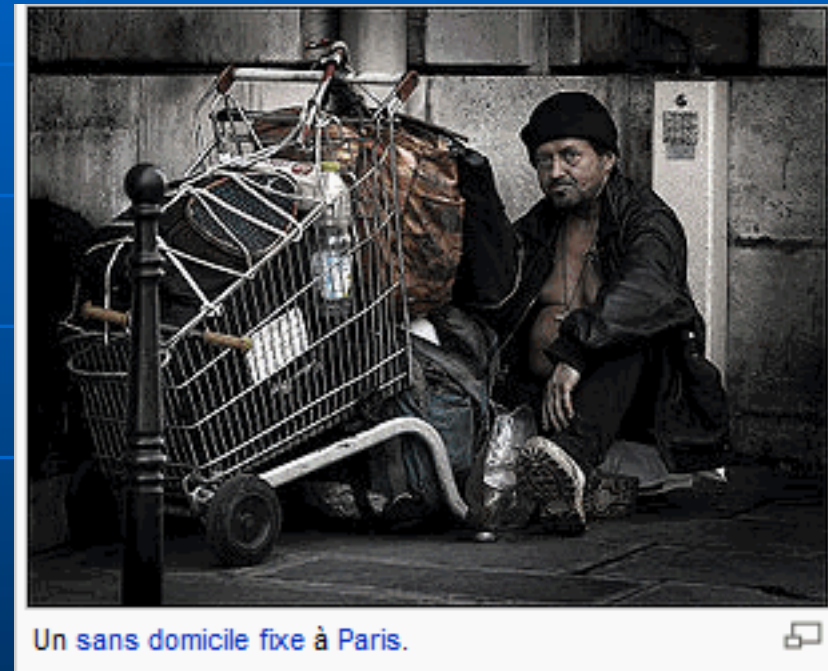
Un sans domicile fixe à Paris.